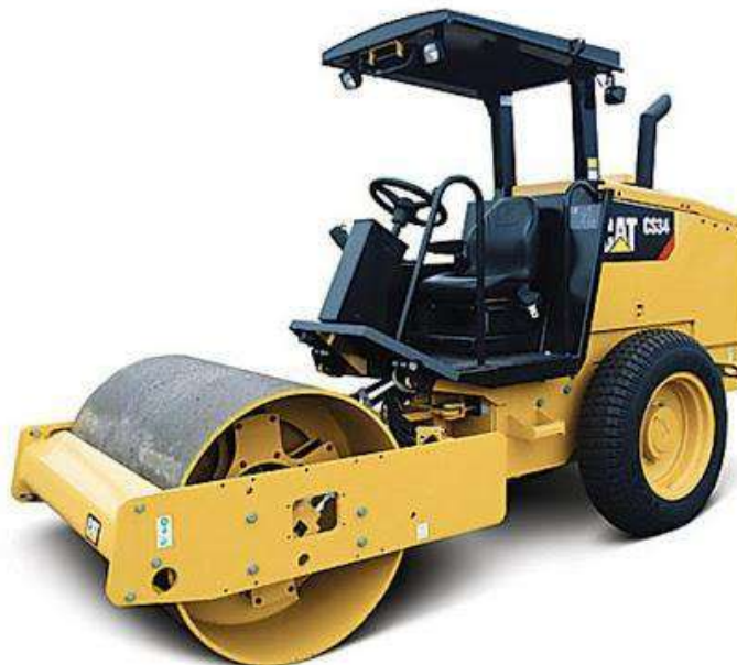
Figura 5. Rulo compactador.