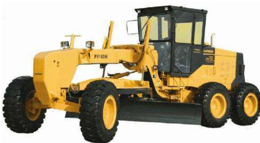
Figura 4. Niveladora