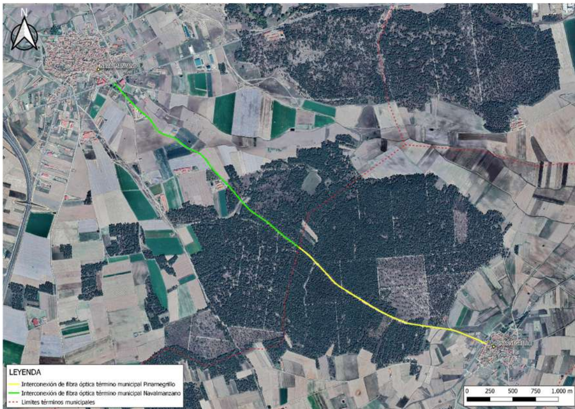
Figura 1. Trazado de la instalación.