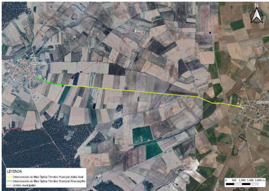
Figura 1. Trazado de la instalación.